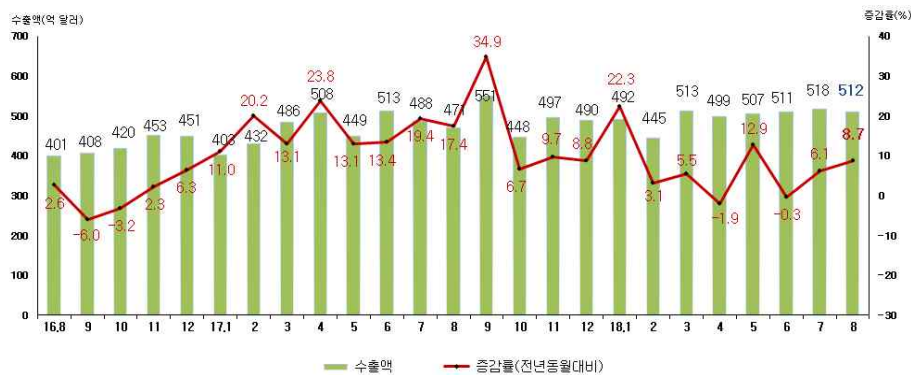
< 월별 수출액 및 증감률 >